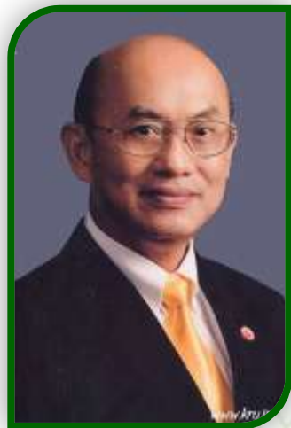
ฯพณฯ นายเกษม วัฒนชัย องคมนตรี