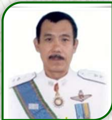
พล.ต.ต.ดร ปิ่นเฉลียว ผบช.ตชด. ภาค ๓