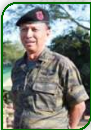
พล.ต.ท ประยุทธ์ อำนวย ผบช.ตชด.