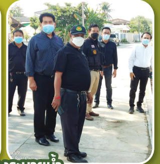
ลงพื้นที่ตรวจสอบการก่อสร้างระบายน้ำ ชุมชนสองแคว 1

แม่สอดน่าอยู่ ก้าวล้ำทันสมัย ภายใต้หลักธรรมาภิบาล