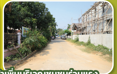
ตรวจสอบพื้นที่เพื่อขอไฟฟ้าเพิ่มบริเวณชุมชนร่วมแรง