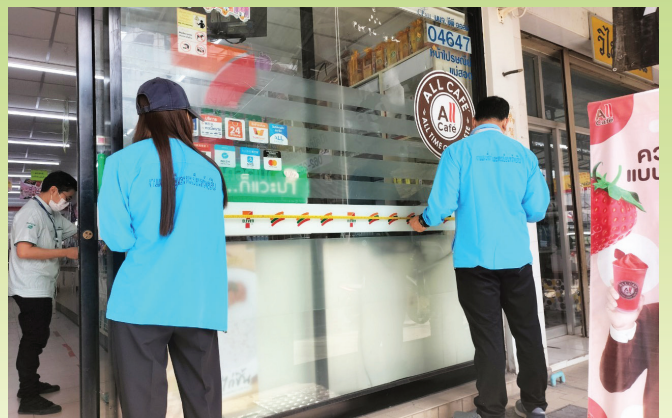
งานสำรวจภาษีป้าย