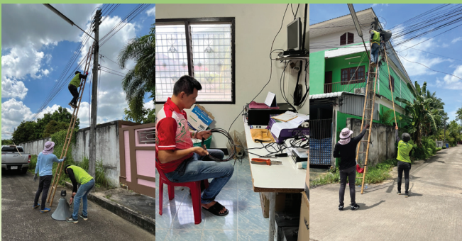
ซ่อมแซมเสียงตามสายภายในชุมชน