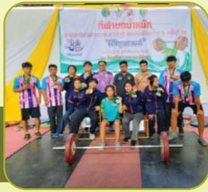
ยกน้ำหนัก