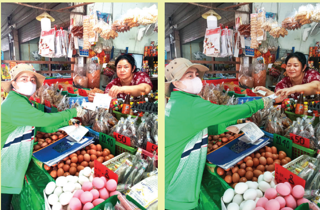
การให้บริการจัดเก็บค่าขยะมูลฝอย และค่ากำจัดขยะ นอกสถานที่