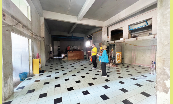
งานสำรวจการใช้ประโยชน์ในที่ดิน และสิ่งก่อสร้าง