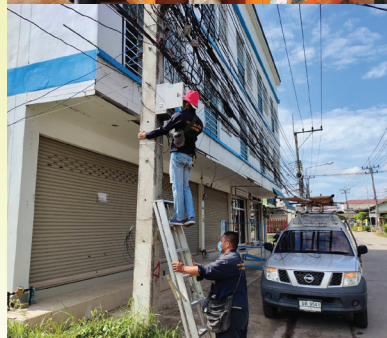
บริการติดตั้ง และซ่อมเคเบิลทีวี เพื่อการศึกษา เทศบาลนครแม่สอด