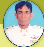
นายไสว มีเงิน