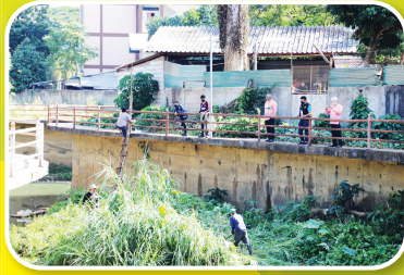
ขุดลอกลำห้วยแม่สอด บริเวณแม่สอดมูลนิธิ สามัคคีการกุศลและ ชุมชนจื่อกจอสამัคคี