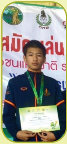
มวยสากล สมัครเล่น