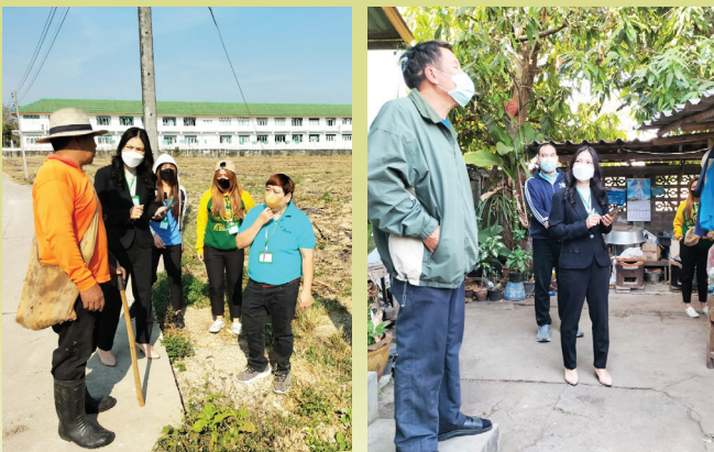
งานสำรวจที่ดินและสิ่งปลูกสร้าง