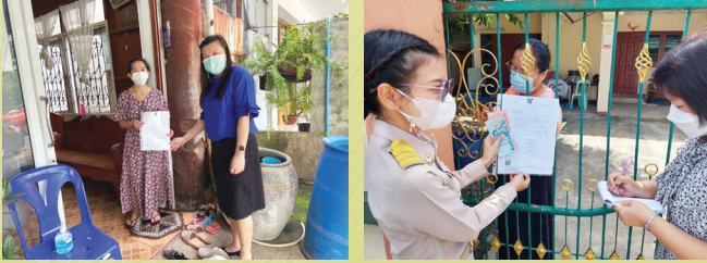
การให้บริการจัดเก็บภาษีที่ดิน และสิ่งปลูกสร้าง ภาษีป้าย ทั้งในและนอกสถานที่