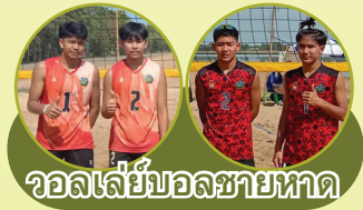
วอลเลย์บอลชายหาด