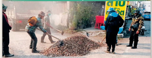
ลงหินคลุกบริเวณร้านลาบลุงเอ็ด