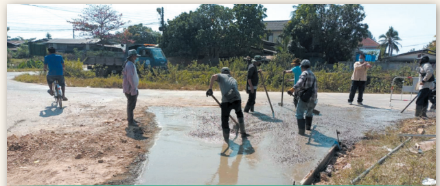
ถนนบริเวณภูเขาอีตัน