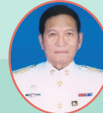
ตาดำรงประทีป สีลา