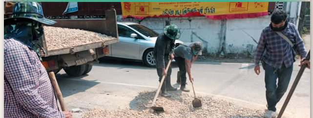
ลงหินคลุกบริเวณหน้าโถงแจ้งเจ๊กง