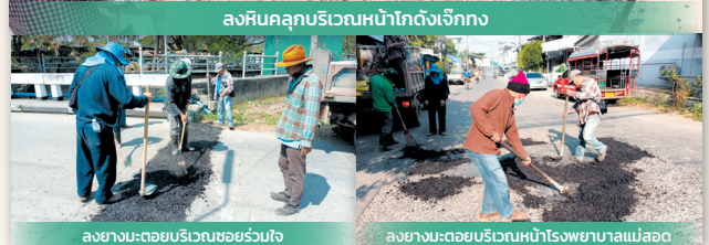
ลงยางมะตอยบริเวณซอยร่วมใจ